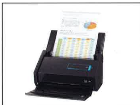
①スキャナーや複合機等でデータ化

画質はチェックシートの記載内容が読み取れる程度とし、400万画素を目安とする。この際、ピントがブレないように留意すること。