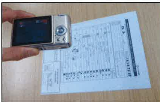
②デジカメで写真撮影