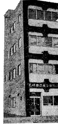
新築された組合事務所

「おが」の文字が目を引く。これは、建築業界のシンボルとして、手をつなぐだけでは、力の集約をはかるべきだ。結婚して、」